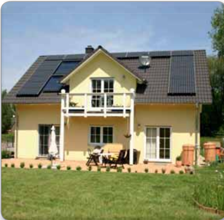
Installateur: Bachstein Solar, Sanyo HIT 210 NKHE 5

Het is raadzaam om een fotovoltaïsche verzekering af te sluiten waarmee uw investering gedekt is voor allerlei uiteenlopende schade. Naast een vergoeding voor de vervangende waarde, omvatten de voordelen tevens een allrisk-dekking voor schade wegens natuurkrachten als storm, hagel of het gewicht van sneeuw. Voordat u een nieuwe polis afsluit, kunt u het beste eerst controleren of bepaalde risico's worden gedekt op grond van uw bestaande verzekering. Wellicht is het mogelijk om deze laatste verzekering tegen een kleine vergoeding uit te breiden of te combineren.