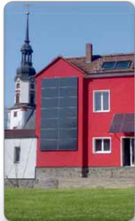
Installateur: Solarleben GmbH